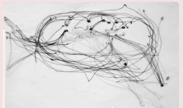
Lignes d'erre des « enfants mutiques »