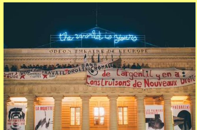
Occupations : Odéon 1968 / TALP Liège 2013 / Teatro Valle Rome 2014 / Odéon 2016