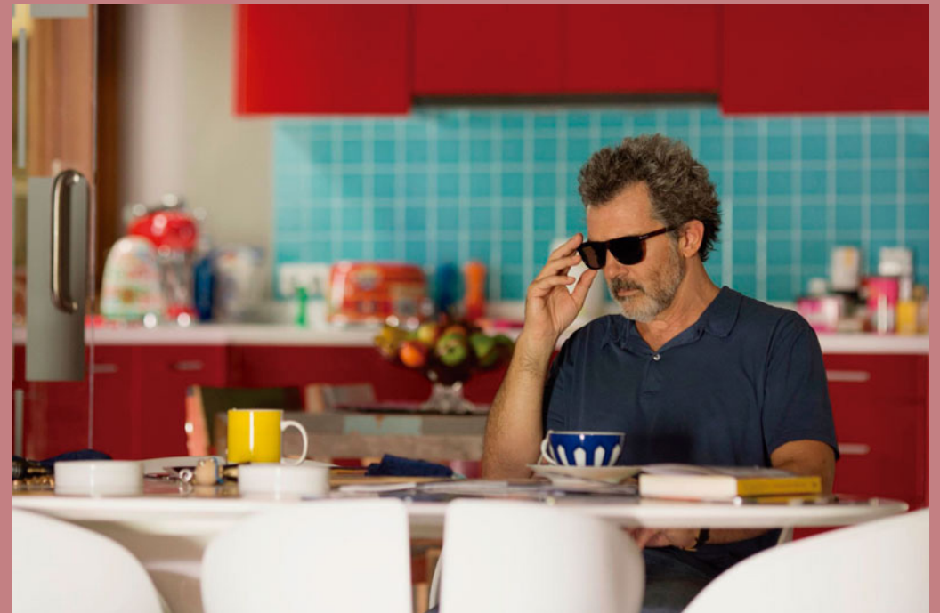
Douleur et gloire, Pedro Almodovar

Tim est un témoin des années 80 et 90. C'est le point de vue subjectif d'un jeune homme qui a vécu l'arrivée du Sida mais aussi le Palace, la découverte de la House Music. Nous aimerions évoquer le passé, sans sombrer dans la tristesse, mais avec sa distance d'aujourd'hui, celle qui lui permet de plaisanter, relativiser. Tim est un quinquagénaire plutôt serein et épanoui, nous l'imaginons comme un personnage d'un film d'Almodovar qui évolue dans un espace coloré, joyeux où surgissent ses souvenirs douloureux : une plage, la montagne, un bel appartement, une fête. Ressentir une mélancolie et aussi de la force d'être dans de tels espaces tout en transportant un passé chargé. C'est cette vitalité là que nous voulons partager et qui donne de la force.